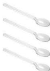
MEXEDOR CAFÉ COLHERZINHA