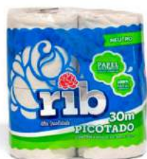
PAPEL HIGIÊNICO F. SIMPLES RIB