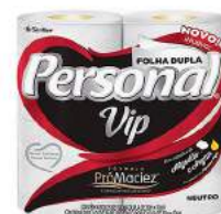
PAPEL HIGIÊNICO F. DUPLA PERSONAL