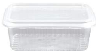
POTE RETANGULAR DIMIG COM TAMPA