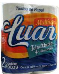
PAPEL TOALHA LUAR