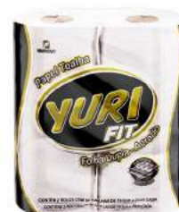
PAPEL TOALHA YURI