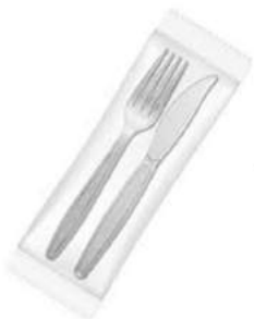
KIT GARFO E FACA REFEIÇÃO