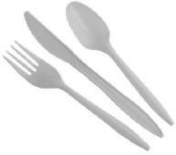
TALHER DESCARTÁVEL REFEIÇÃO MASTER