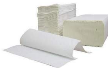
PAPEL TOALHA INTERF. BRANCO/CELULOSE ECONÔMICO/PREMIUM