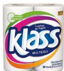
PAPEL TOALHA KLASS