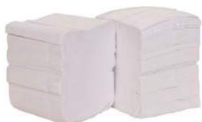
PAPEL HIGIÊNICO INTERF. CAI-CAI