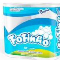
PAPEL HIGIÊNICO F. SIMPLES FOFINHO