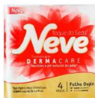
PAPEL HIGIÊNICO F. DUPLA NEVE