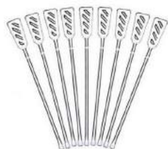
MEXEDOR DE CAFÉ