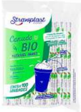
CANUDO COM 100 UNIDADES