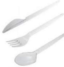
TALHER DESCARTÁVEL SOBREMESA