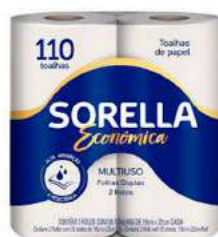
PAPEL TOALHA SORELLA