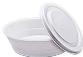
MARMITEX EPS COM TAMPA 500/750/1100ML