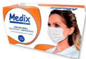
MÁSCARA DESCARTÁVEL 50 UNIDADES