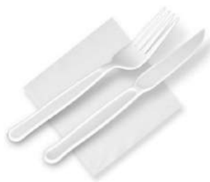
KIT GARFO, FACA E GUARDANAPO