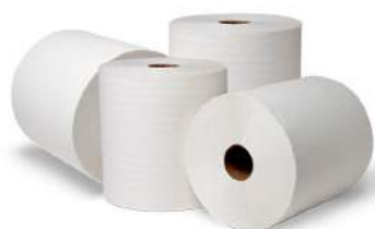
PAPEL TOALHA BOBINA