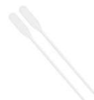
MEXEDOR DE DRINK