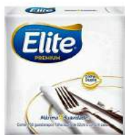
GUARDANAPO ELITE GG