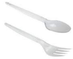
TALHER DESCARTÁVEL REFEIÇÃO LEVE