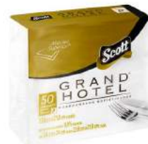
GUARDANAPO GRAND HOTEL