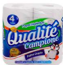
PAPEL HIGIÊNICO F. DUPLA QUALITÉ