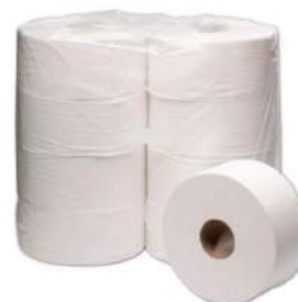
PAPEL HIGIÊNICO ROLÃO 8 ROLOS 300M BRANCO/CELULOSE/PREMIUM