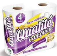
PAPEL HIGIÊNICO F. SIMPLES QUALITÉ