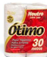
PAPEL HIGIÊNICO F. SIMPLES ÓTIMO