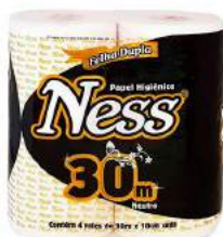
PAPEL HIGIÊNICO F. DUPLA NESS