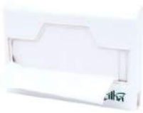
FORRO PARA ASSENTO SANITÁRIO