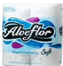
PAPEL HIGIÊNICO F. SIMPLES ALVEFLOR