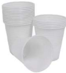
COPO DESCARTÁVEL (PACOTE OU CAIXA) 50/180/200/300ML